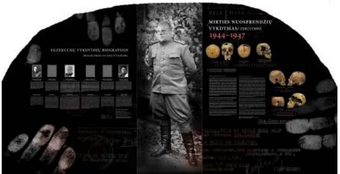
Viena iš ekspozicijos salių