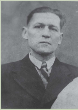
Jonas Žemaitis. 1946 m. rugsėjis.

1953 m. gegužės 30 d., panaudojus migdomąsias dujas, Jurbarko r. Šimkaičių miške įrengtame bunkerioje suimtas Lietuvos laisvės kovos sąjūdžio (LLKS) Tarybos 1949 m. vasario 16 d. Deklaracijos signataras, LLKS Tarybos prezidento pirmininkas, partizanų generolas, ketvirtasis Lietuvos prezidentas Jonas Žemaitis-Vytautas . 1953 metai – organizuoto partizaninio pasipriešinimo Lietuvoje pabaiga.