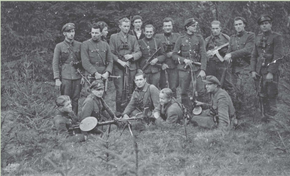
Jungtinės Kęstučio apygardos vadas J. Žemaitis-Tylius (sėdi viduryje) su savo apygardos partizanais apie 1947 m.

1953 m. gegužės 30 d., panaudojus migdomąsias dujas, Jurbarko r. Šimkaičių miške įrengtame bunkerioje suimtas Lietuvos laisvės kovos sąjūdžio (LLKS) Tarybos 1949 m. vasario 16 d. Deklaracijos signataras, LLKS Tarybos prezidento pirmininkas, partizanų generolas, ketvirtasis Lietuvos prezidentas Jonas Žemaitis-Vytautas . 1953 metai – organizuoto partizaninio pasipriešinimo Lietuvoje pabaiga.