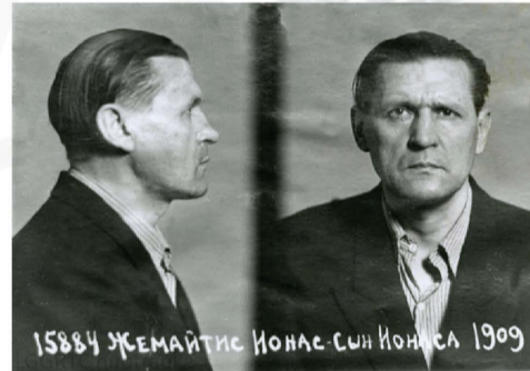
Paskutinė J. Žemaičio nuotrauka, daryta KGB vidaus kalėjime. Vilnius, 1953 m.

Ir staiga lyg žaibas būtų perskrodęs tylą ir gražinęs į realybę – išgirdo šlykštą rusišką keiksmą. Pajuto spyrį į šoną, nuo kurio nusirito į kitą kėbulo kraštą. [...] Suprato esąs nelaisvėje.