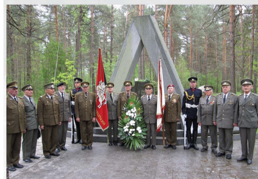
Buvę Lietuvos vietinės rinktinės karių sąjungos nariai prie paminklo Paneriuose sušaudytiems kariams. 2011 m. gegužės 17 d. Panerių memorialas. Vilnius