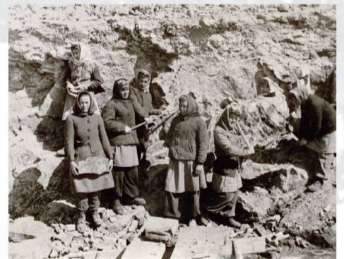
Kengyro kalinės kapoja akmenis. Iš LGGRTC vykdytos valstybinės programos „Atsiminimų apie tremties ir kalinimo vietas, laisvės kovų dalyvių rinkimas 1999–2001 m.“ rinkinių